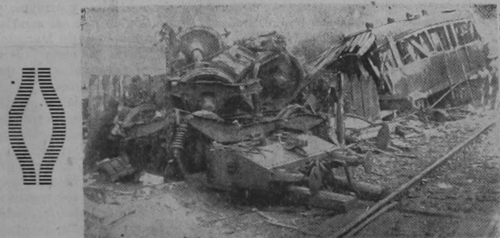
Los accidentes ferroviarios en Francia se están repitiendo en forma alarmante. El gravado el choque de Sens, en el cual resultaron varios muertos y heridos

El saldo a favor de dicha Caja ha tenido una pequeña baja de un día a otro, como en los presentes datos se nota.